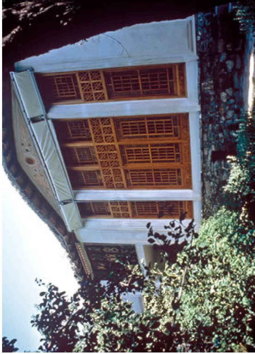
منزل بهاء الله في طفولته وشبابه هدمته الحكومة الإيرانية في سنة 1981